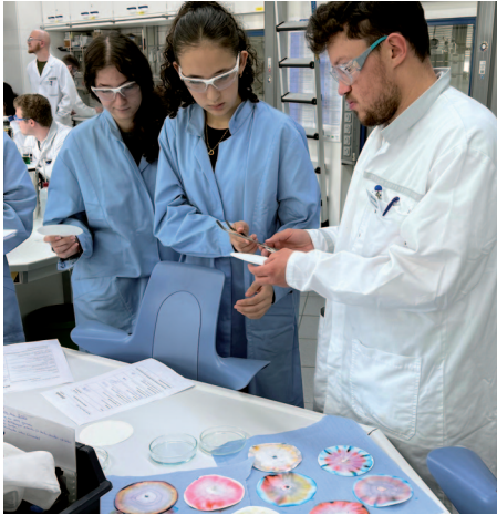
▲ Jugendliche der Arche auf Betriebsbesuch

Dank des Netzwerks der Arche in Frankfurt a. M. zu unterschiedlichen Unternehmen können Jugendliche mögliche Berufe näher kennenlernen und sich anhand ihrer Interessen und Stärken für ihren zukünftigen Weg entscheiden. Dabei gibt es jede Menge Unterstützung.