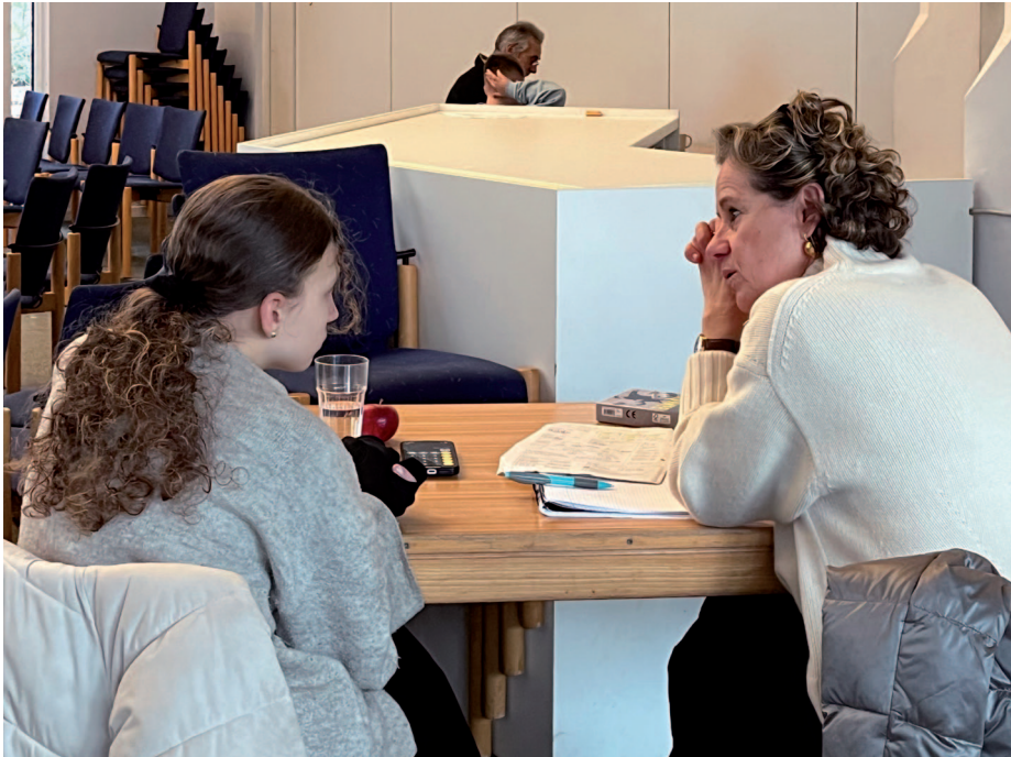
▲ Bildung durch Beziehung ist der Kerngedanke des Lernorts in der Arche

nicht mehr aufhören. Freudestrahlend ging sie schließlich hinaus. Ich muss auch an Leila* denken, die schon seit vier Jahren bei uns im Lernort ist. In dieser Zeit blühte Leila auf. Sie lässt kaum eine Stunde ausfallen und ist hochmotiviert bei der Sache. Sie hat unheimlich an Selbstbewusstsein gewonnen und in der Schule große Fortschritte gemacht. Fast noch mehr aber freut es mich zu sehen, wie die Beziehung sich positiv auf ihre Persönlichkeitsentwicklung auswirkt, weil sie durch den Lernort jemanden hat, der an sie glaubt und für sie da ist.