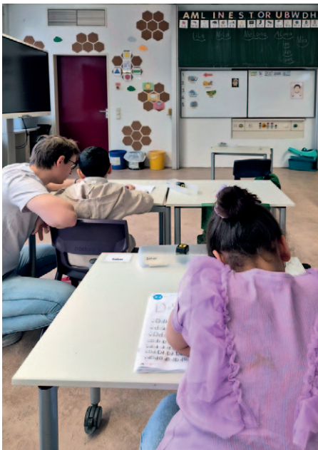
▲ Für eine gute Lernatmosphäre werden in der Klasse 1E zusätzliche Lehrkräfte eingesetzt

Bildung durch Beziehung ist ein Ansatz, mit dem an einer Brennpunktschule in Berlin-Hellersdorf vielversprechende Erfolge erzielt werden