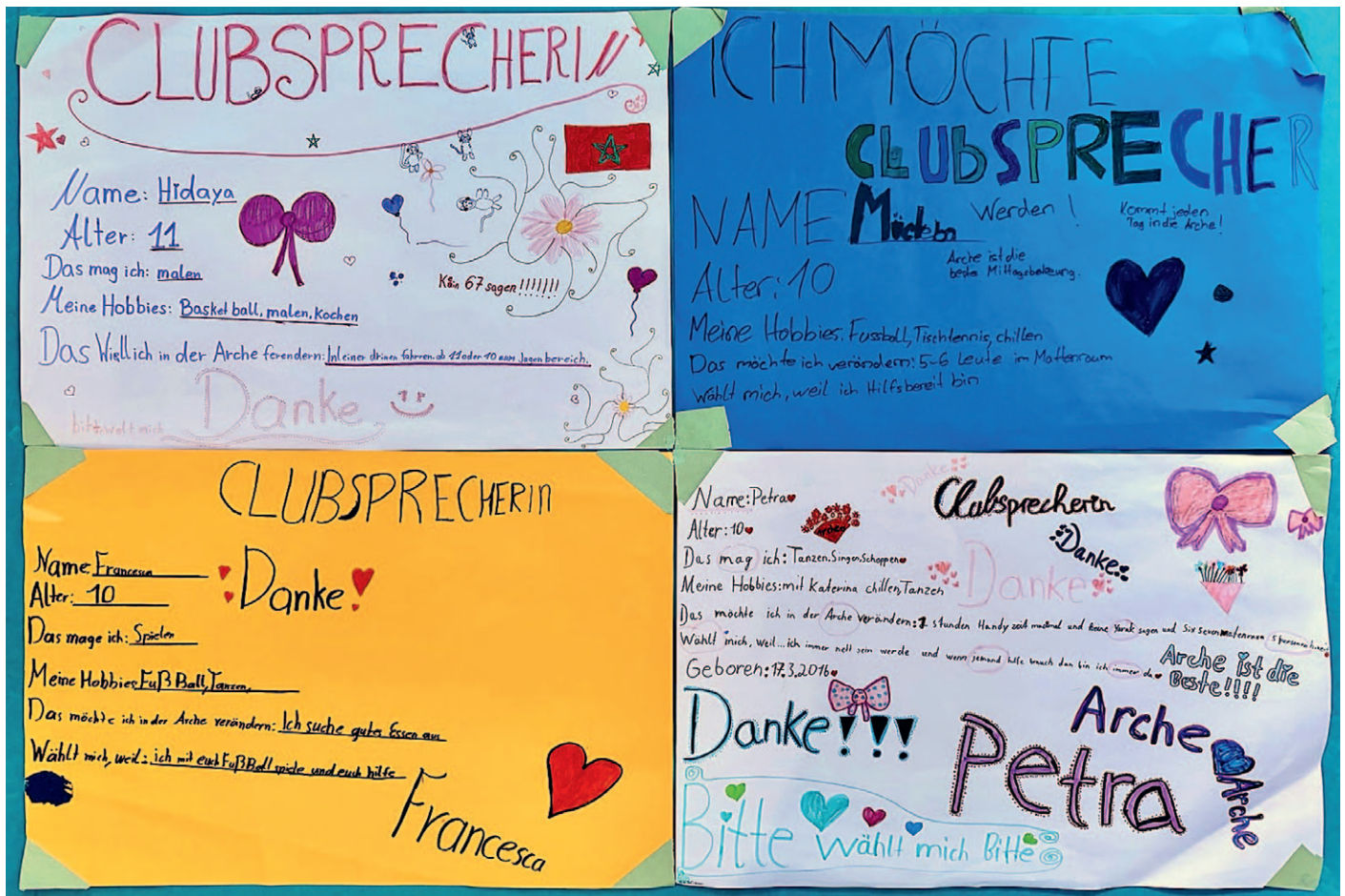
▲ Wahlplakate für die Kandidatur zur Kinderkonferenz der Arche München

Anerkennung, sondern auch Verantwortung. Als Clubsprecher fungiert er als zusätzliches Bindeglied zwischen Kindern und Mitarbeitenden. Er bringt Ideen ein, unterstützt bei der Auswahl des Mittagessens und trägt Anliegen aus der Gruppe