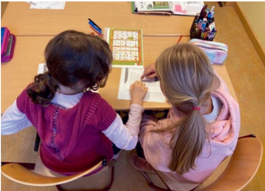
▲ Mit dem Intensiv-Lerncoaching lernen Kinder, ihren eigenen Fähigkeiten zu vertrauen

Während der Coronapandemie startete in der Arche ein Modellprojekt für intensives Lerncoaching. Dessen wissenschaftliche Evaluation beweist, dass wirksame Förderung gelingen kann, wenn die Rahmenbedingungen stimmen.