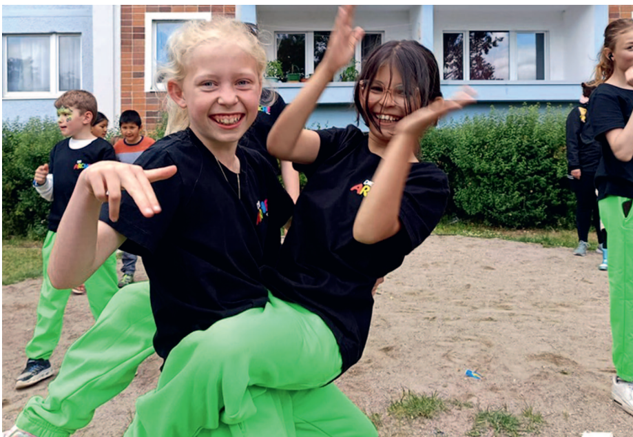
▲ In der Tanzgruppe der Arche Rostock gewinnen die Kinder Selbstbewusstsein

Bildung ist viel mehr als reines Bücherwissen. Das zeigt uns eindrücklich ein Tanzprojekt in der Arche Rostock.