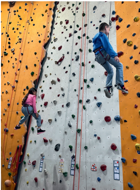
▲ Ausflug einer Kleingruppe zum Klettern

Besondere Herausforderungen erfordern eigene Lösungen: Die Hamburger Archen realisieren daher erfolgreich neue Kleingruppenformate