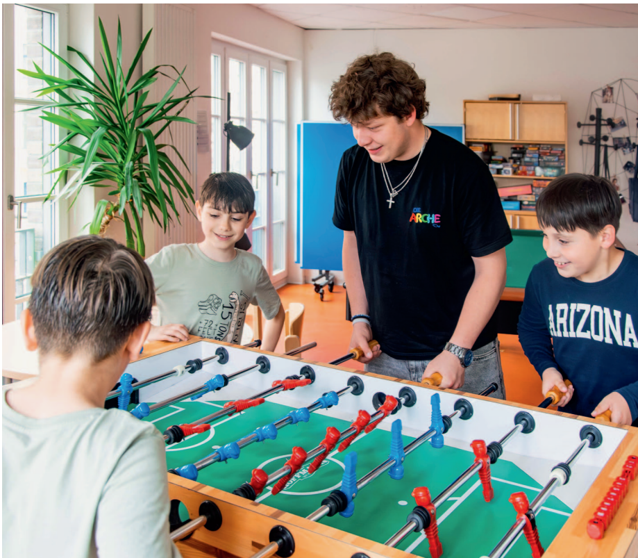
▲ Die Arche ist für die Kinder ein Schutzraum, in dem sie auf verlässliche Partner treffen

Bildung wird in der Arche vor allem durch Beziehung vermittelt. Kinder finden hier Unterstützung beim Lernen, ohne den sonstigen Druck. Sie erleben das Gefühl, auch Fehler machen zu können, immer wieder neu versuchen zu dürfen, ohne harte Konsequenzen fürchten zu müssen. Sie wissen, dass sie hier verlässliche Partner haben, die sie dabei fördern, dass sie hier Wertschätzung erfahren, obwohl sie in ihrem sonstigen Alltag oft anecken. In der Arche fühlen sie sich ermutigt. Hier können sie sich ausprobieren, ihre „Skills“ und Talente entdecken – denn Dank Spenden sowie viel persönlichem und ehrenamtlichem Engagement können wir mit individuellen Projekten den entsprechenden Rahmen für sie schaffen. Darüber berichten wir auch in dieser Ausgabe der Arche-News.