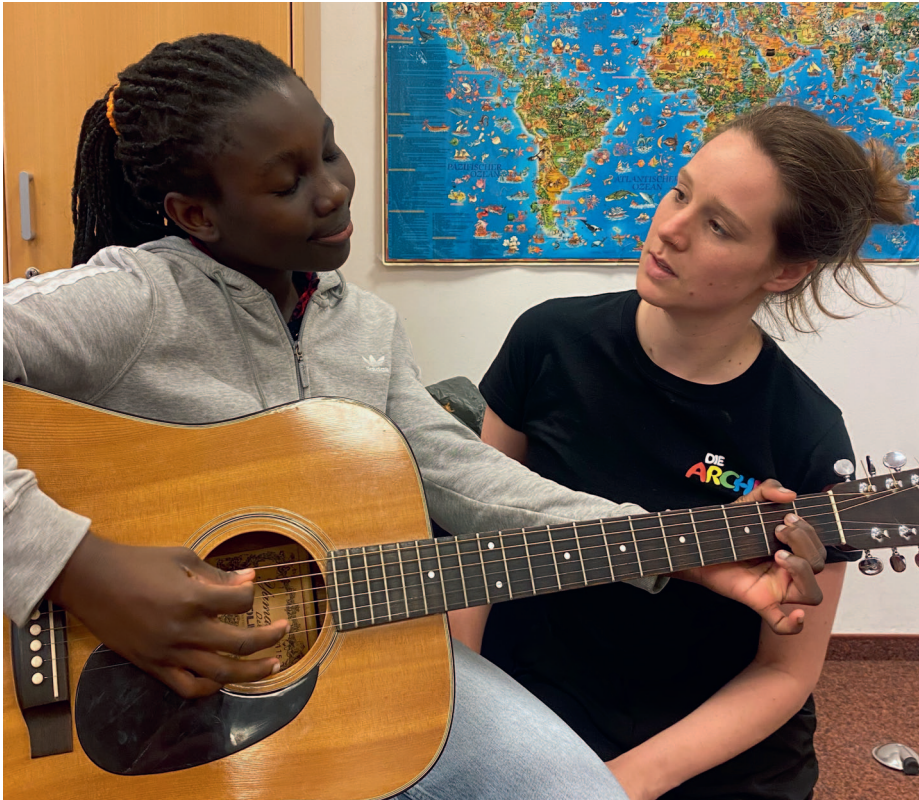
▲ Beim „Skills Day“ in Köln konnten die Kinder erste Akkorde auf der Gitarre entdecken

teilzunehmen. Dies gab uns die Möglichkeit, mit ihr über die Bedeutung von Verpflichtung und Verlässlichkeit ins Gespräch zu kommen. Sie nahm die Herausforderung an. Mit Disziplin und Zuverlässigkeit machte sie Fortschritte auf der Gitarre und entdeckte ihr Talent und neue Vorlieben. Der Workshop wurde für sie zu einer nachhaltig bereichernden Erfahrung.